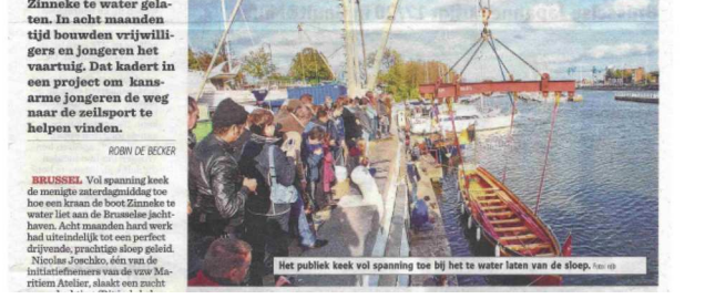
Het publiek keek vol spanning toe bij het te water laten van de sloep.

In de jachthaven van Brussel werd de Bantry Bay sloep Zinneke te water gelaten. In acht maanden tijd bouwden vrijwilligers en jongeren het vaartuig. Dat kadert in een project om kansarme jongeren de weg naar de zeilsport te helpen vinden.