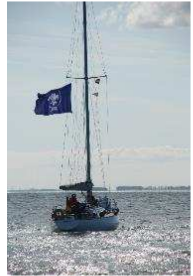
Solidair Zomerkamp van 5 tem 15 augustus.