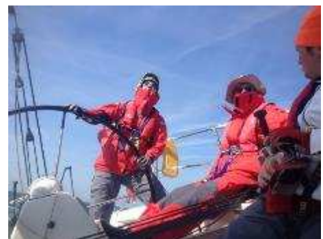
Vorming van het zeilkader : oversteek naar Ramsgate in april.