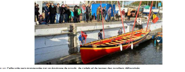
Le public a vu avec enthousiasme les premiers coups d'avirons de la Zinneke.

JEAN BERNARD Publié le mardi 11 novembre 2014 à 14h37 - Mis à jour le mardi 11 novembre 2014 à 14h37